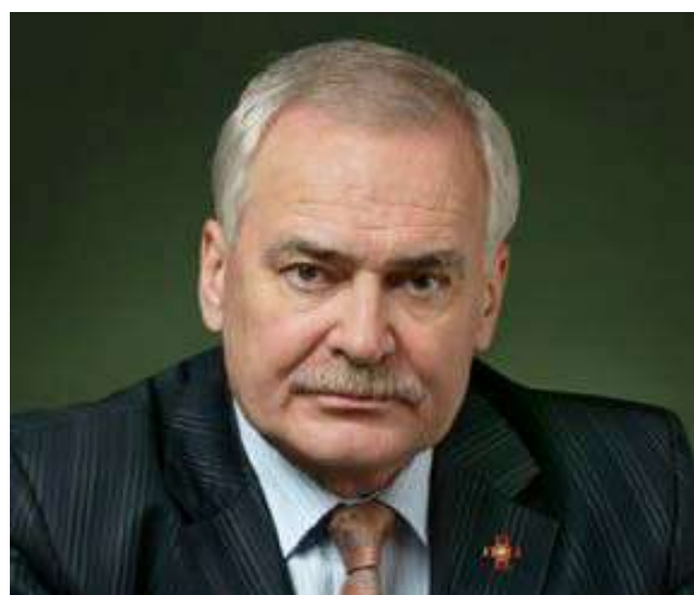
БУРОВ НИКОЛАЙ ВИТАЛЬЕВИЧ Советский, российский актёр и общественный деятель