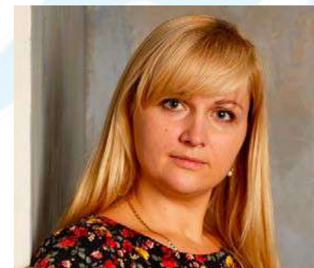
АБЛЕЦ ЮЛИЯ СЕРГЕЕВНА Председатель Комитета по молодежной политике Санкт-Петербурга