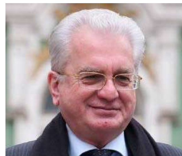
ПИОТРОВСКИЙ МИХАИЛ БОРИСОВИЧ Директор Государственного Эрмитажа