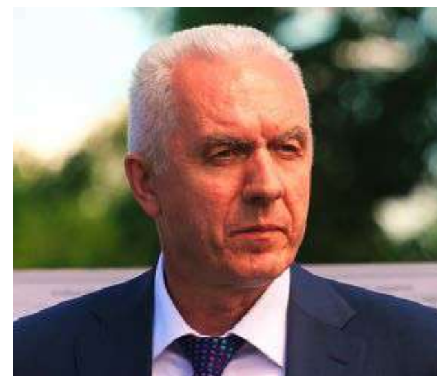
ГУЦАН АЛЕКСАНДР ВЛАДИМИРОВИЧ Полномочный представитель Президента Российской Федерации в Северо-Западном федеральном округе