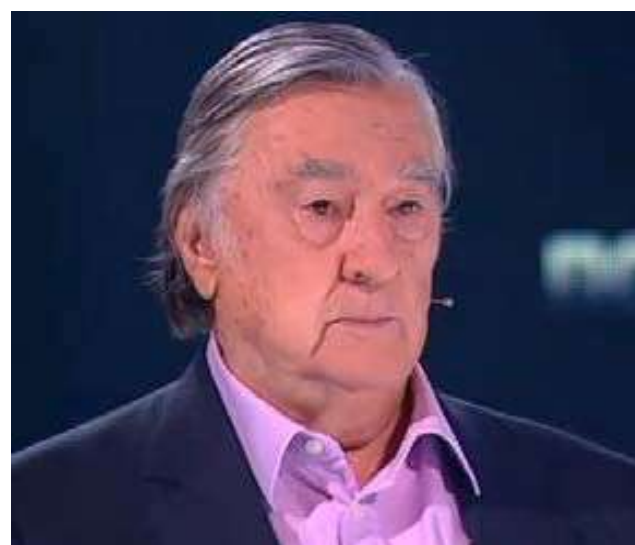
ПРОХАНОВ АЛЕКСАНДР АНДРЕЕВИЧ Российский политический деятель, писатель, сценарист, публицист, журналист, общественный деятель