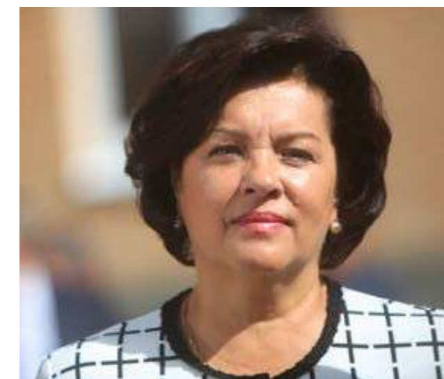
ВОРОБЬЕВА ЖАННА ВЛАДИМИРОВНА Председатель Комитета по образованию Санкт-Петербурга