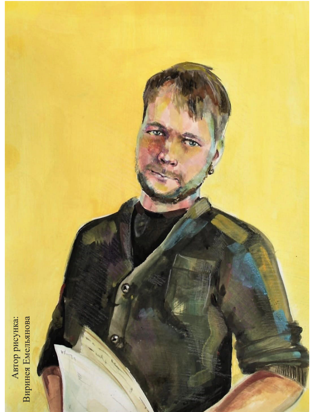
Автор рисунка: Виринея Емельянова

- Какую роль сыграл этот конкурс в вашей педагогической карьере?