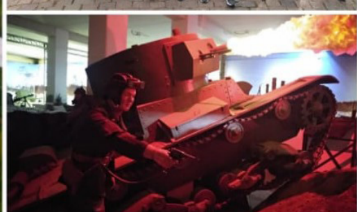
Остальные фото с Дня здоровья - на стр. 6